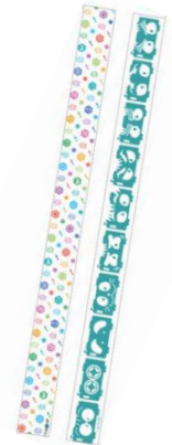
マスキングテープ 400円