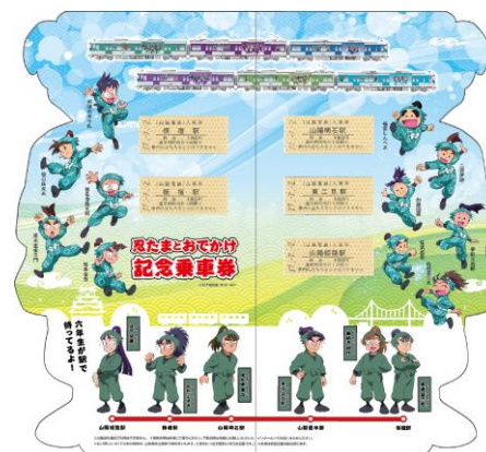
忍たまとおでかけ記念乗車券