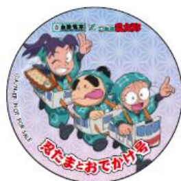
オリジナル缶バッジ