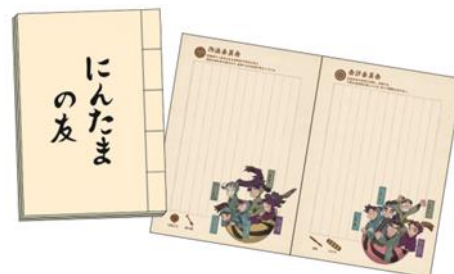
ラリーコンプリート賞 オリジナルノート(B6サイズ)