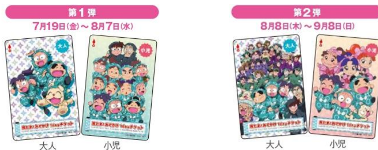
忍たまとおでかけ 1day チケット（券面デザイン）