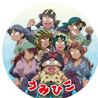
ロープウェイのヘッドマーク