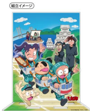
アクリルスタンド 1,620円