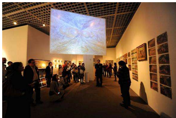
第3回 恵比寿映像祭 展示の様子

“世界的な文化創造都市・東京”を実現するための担い手を育成する、質の高いプログラムや参加型プログラムが豊富なこの期間を、是非ご注目ください。