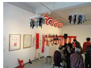
墨東まち見世 2010 ネットワークパーティの様子

※その他、11月後半～2月のプログラムについては、別紙「プログラム一覧」をご覧ください。