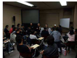
Next Masters Tokyo 2010 レクチャーの様子