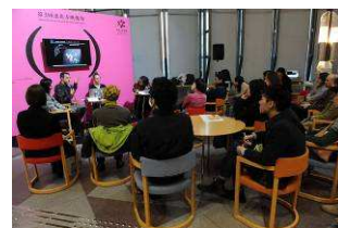
第3回 恵比寿映像祭 ラウンジトーク