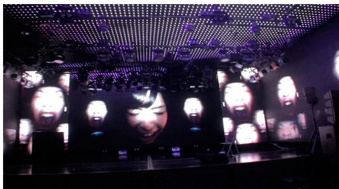
会場内イメージ(全面LEDに映し出されるBACARDIロゴや収集されたSCREAM)