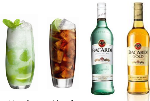
バカルディ モヒート