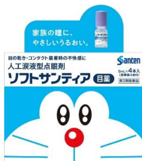
〈ソフトサンティア 4 本入〉

是非この機会に、ドラえもん・ドラミちゃんがデザインされた、限定パッケージの「ソフトサンティア」「ソフトサンティアひとみストレッチ」をお買い求めください。