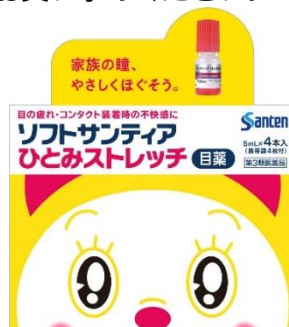
〈ソフトサンティアひとみストレッチ 4 本入/2 本入〉