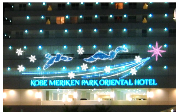
※外壁イルミネーション 点灯イメージ