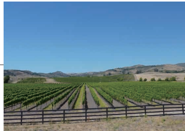
シャトー イガイタカハ ワイナリー