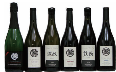
シャトー イガイタカハ ワイン

ご予約・お問い合わせは フレンチレストランOZAWA TEL.082-240-5553 ※第2・4水曜定休(3月は第2木曜・第4水曜定休)