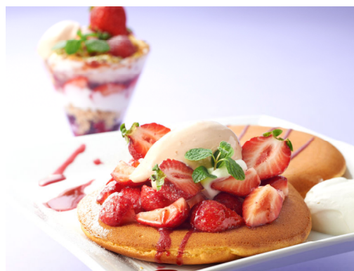
①あまおうパンケーキ ②あまおうパフェ