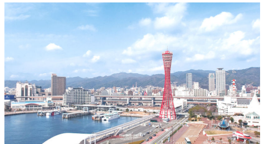
「タワーView」からの眺望 一例

世界初のパイプ構造の観光タワーとして1963年11月21日に開業。 世界にも類を見ない斬新な「つづみ型」を模したデザインのタワーは、赤く、中央がくびれた優美な曲線の形から「鉄塔の美女」とも称され、夜にはライトアップされた姿が神戸の夜景を彩り、50年にわたって多くの人びとに愛されてきました。