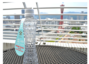
タワーを模したペットボトル