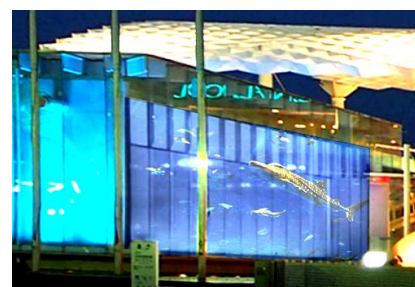
アクアホール 光の演出 イメージ