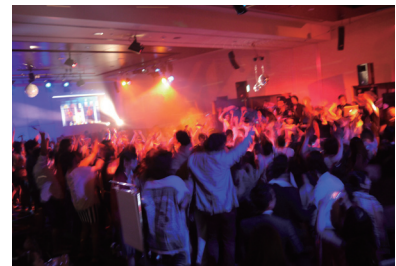
前回のNew York!! New York!!の様子