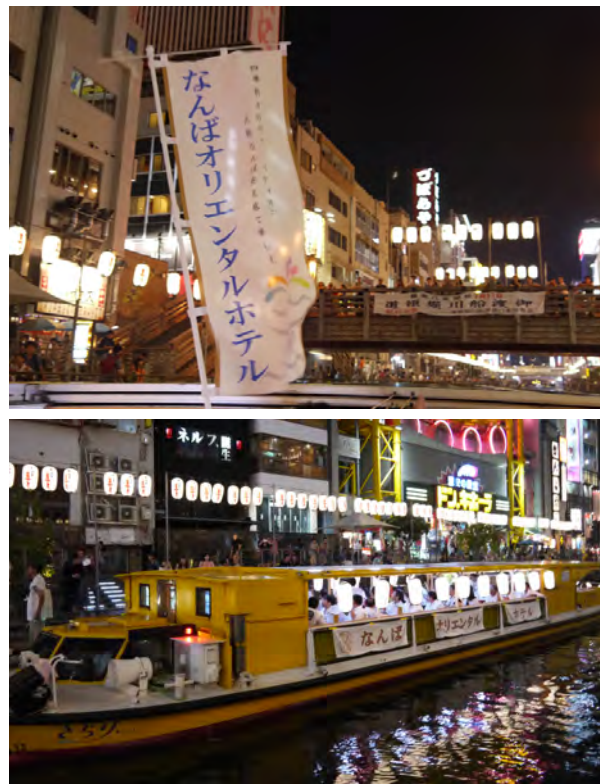
▶ 川沿いの皆様と大阪締めを交わします