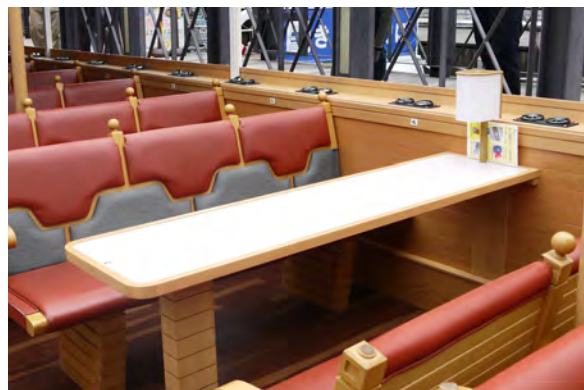
▶ 屋根付きの観光船でゆったりとお楽しみ頂けます。

詳細：お弁当、お飲み物(フリードリンク) 難波八阪神社の手ぬぐい・うちわ、お土産 ご乗船記念写真 付き