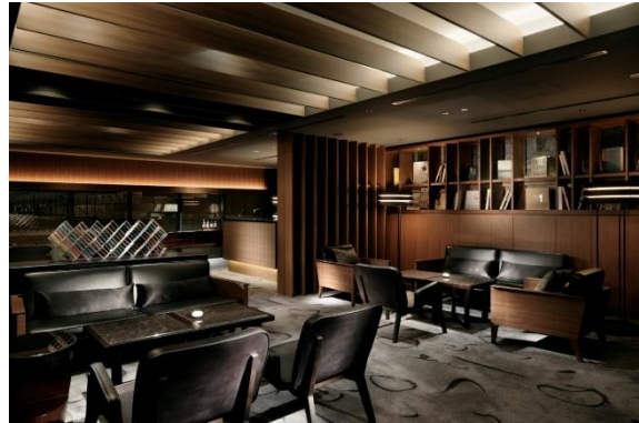
【ザ・キャピトル バーでの優待内容 イメージ】

■Uber Black 初回ご乗車時 10,000 円分が無料に！ラグジュアリーカード会員限定でスペシャルクーポンをプレゼント 2010年に米国サンフランシスコでスタートし、日本では2013年からハイヤー配車サービスであるUber Blackを開始したUber Japanとの取組みにより、Uber Black 初回ご乗車時にご利用いただける10,000円分のスペシャルコードをラグジュアリーカード会員限定で先着1,000名にプレゼントする期間限定の会員優待が開始されました。家やオフィス、お出かけ先などからスマートフォンアプリにて簡単手軽に最適なタイミングでご乗車が可能な為、上質でストレスフリーな移動をご体験いただけます。特別コードお申込期限は2019年10月10日まで、ハイヤーご利用期限は10月31日までとなります。キャンペーン詳細はこちらから： https://myluxurycard.co.jp/info/uber.html