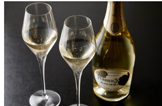
【ザ・キャピトルホテル 東急での宿泊優待内容 イメージ】