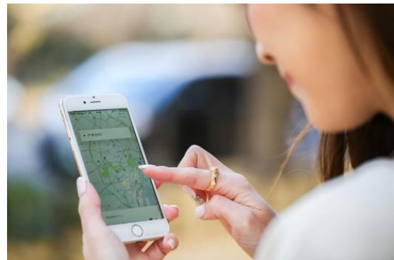
【Uber Black イメージ】