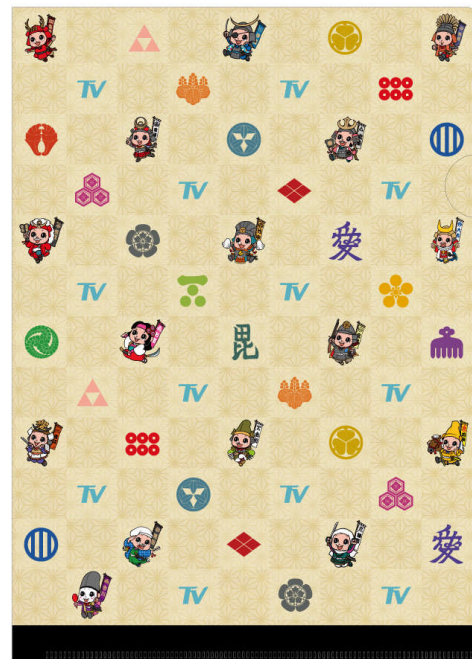
【B】キャラクターモノグラム