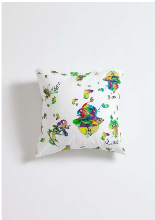
商品名：“cushion” # €Y㊿ 価格：9,999 円（税込） 素材：カバー COTTON 100% , クッション POLYESTER 100% サイズ：45×45cm