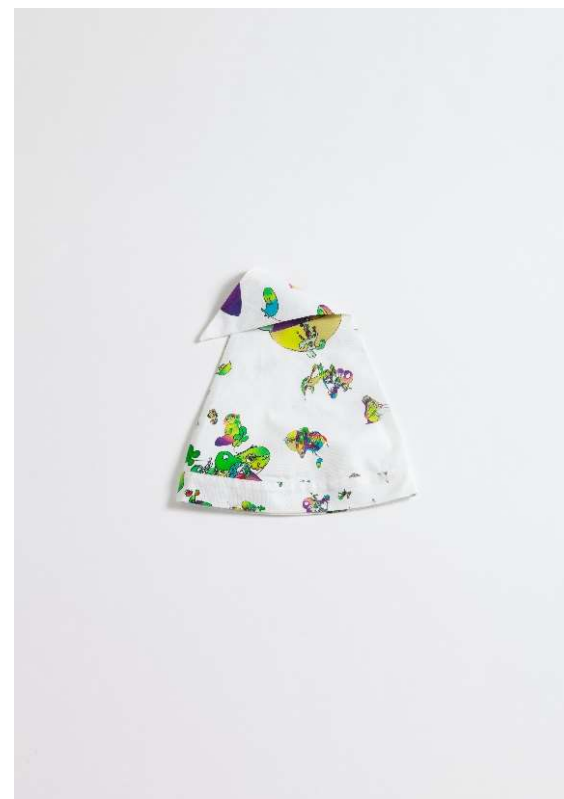
商品名：“night cap” # €Y㊿ 価格：5,555 円（税込） 素材：COTTON 100% サイズ：One size free