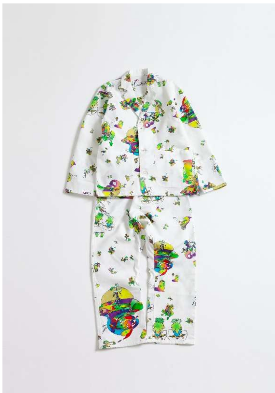
商品名：“day jr.” pajama # €Y㊿ 価格：22,222 円（税込） 素材：COTTON 100% サイズ展開：jr. (120-140cm)