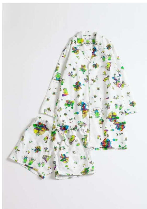
商品名：“day long” pajama # €Y㊿ 価格：33,333 円（税込） 素材：COTTON 100% サイズ：0 (XS~S) / 1 (S~M) / 2 (L~LL)