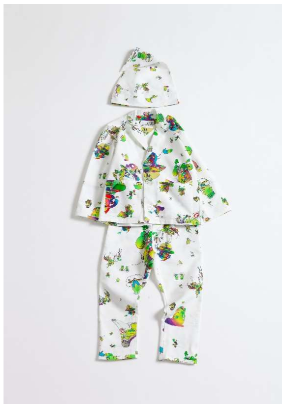
商品名：“lil day” pajama # €Y㊿ 価格：22,222 円（税込） 素材：COTTON 100% サイズ展開：lil (90-110cm)