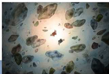
鋤柄真希子 (中央なし) Sca402