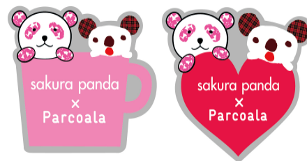
さくらパンダ×パルコアラピンバッジ

東北応援チャリティー企画として、人気キャラクターの「さくらパンダ」と「パルコアラ」が仲良く並んだピンバッジ2種類、各200円を特別販売。（ピンバッジの収益金の一部は、NPO 法人「世界の子どもにワクチンを日本委員会」が行う東日本大震災被災地支援「JCV子どもの笑顔プロジェクト」に寄付いたします。）