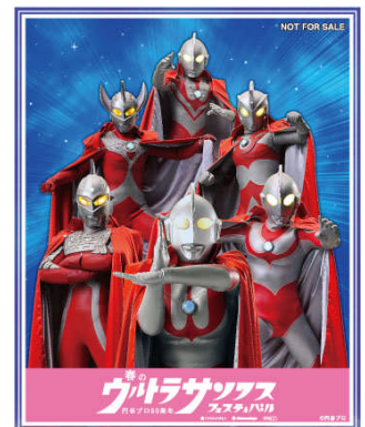
「ウルトラ兄弟オリジナルステッカー」