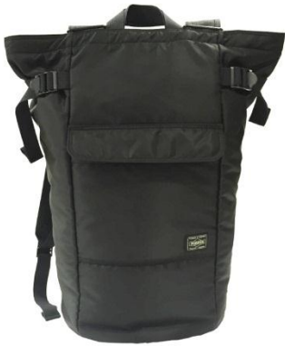
正面から。この形・この素材にこだわりました。 真ん中のポケットもポイント！ ※ポケットにはボタンが2個つきます。