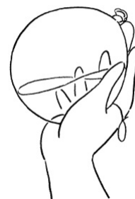
たぶん / 2023年 アクリル板・墨・透明アクリル絵の具・ アクリルガッシュ 440×318