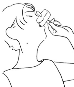
溶ける / 2023年 アクリル板・墨・透明アクリル絵の具・ アクリルガッシュ 440×321,