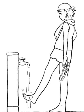
砂は落として / 2023年 アクリル板・墨・透明アクリル絵の具・ アクリルガッシュ 435×585