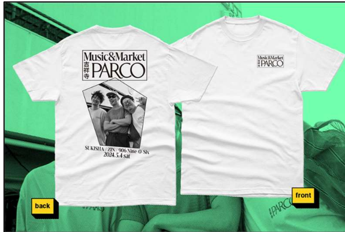
▲SUKISHA×906-Nine-O-Six×ZIN フォトT 販売価格：6,000円（税込・送料込み）