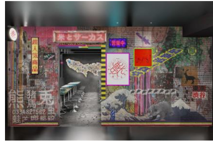
B1F「米とサーカス」イメージパース