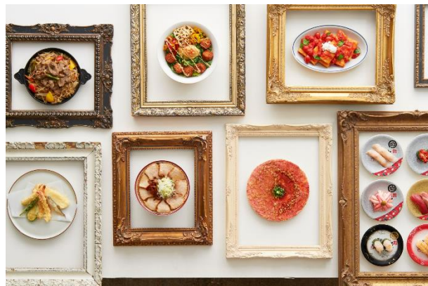
7F RESTAURANT SEVEN