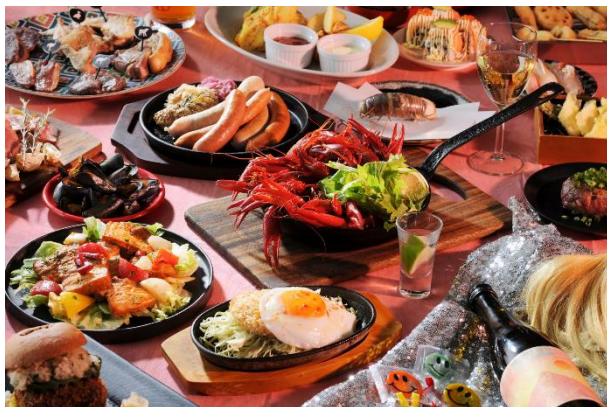
B1F CHAOS KITCHEN

4Fダイニングには、森枝幹シェフのレストラン「chompoo」がオープンします。“日本初上陸”ではない、“スパイシーなだけ”ではない、フレッシュハーブをふんだんに使った体が喜ぶ“しみじみおいしい”タイ料理屋。クリエイティブな実力派シェフの新しい食の提案を行います。