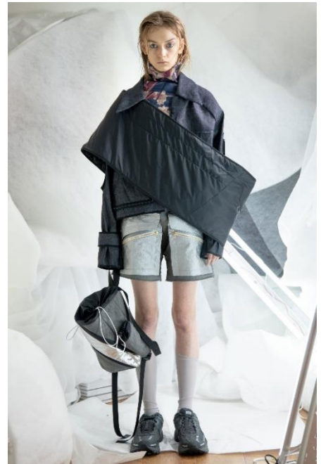
ブランド2019A/w/ルック 左からNON TOKYO、BODYSONG.、BALMUNG

「NEXT AGE PARCO」は「日本の若手デザイナーの発掘と支援」を目的としたプロジェクトとなり、今回のファッションショー支援より始動します。パルコは本プロジェクトで、国内の若手3ブランドのRakuten Fashion Week TOKYO公式スケジュールにおけるショー開催を支援いたします。今回、「NON TOKYO(ノントーキョー)」、「BODYSONG.(ボディソング)」、「BALMUNG(バルムング)」が渋谷PARCOでのポップアップショップ「Designers POPUP by MetroTOKYO」の販売促進も兼ね、ショーを行います。