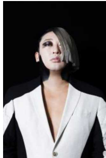
アルセーヌ・ダルタニアン (パルコNo.1モデル)

YouTube登録者数約48万人!総再生回数約1億回! パルコNo.1モデル、清純派女優ほか21人のクリエイターとアンドロイド&妖怪も登場!? ロバート・秋山の大人気企画・単行本第3弾絶賛発売中!