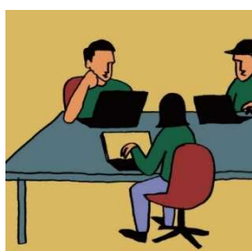
FREE ADDRESS フリーアドレス