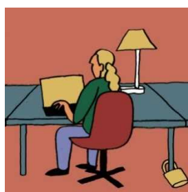
PRIVATE DESK 固定デスク