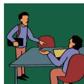
DROP IN ドロップイン