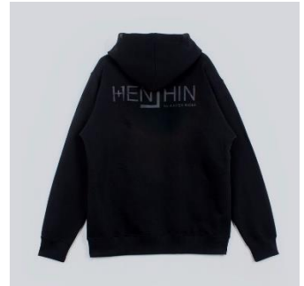
ロゴデザインTシャツ | HENSHIN by KAMEN RIDER 各7,700円