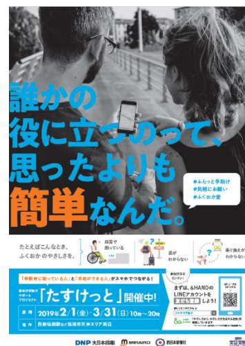
サポーター向けポスター

DNP は本実証実験の基となる「&HAND」*2 構想に 2017 年の発案段階から参画しており、これまでにさまざまな企業や自治体と連携し、2019 年度に事業化を目指した実証実験を推進しています。本実証実験は、2017 年 12 月に都内の地下鉄で実施した「立っているのがつらい妊婦と席をゆずりたい乗客をマッチングする実証実験」、2018 年 8 月に JR 大阪駅で行った「移動に困った人とサポーターをつなぐ実証実験」に続く第 3 弾の取り組みです。生活者の多様なニーズをより広くすくい上げる工夫を構築しながら、「手助けを必要とする人」と「手助けする人(サポーター)」の双方の相互理解を促し、心のバリアフリーを実現していきます。