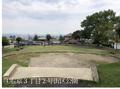
④右京3丁目2号街区公園