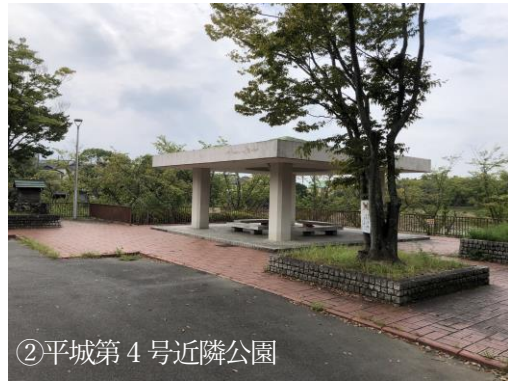
②平城第4号近隣公園