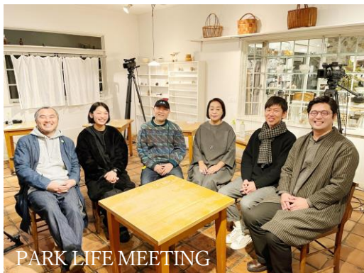
PARK LIFE MEETING