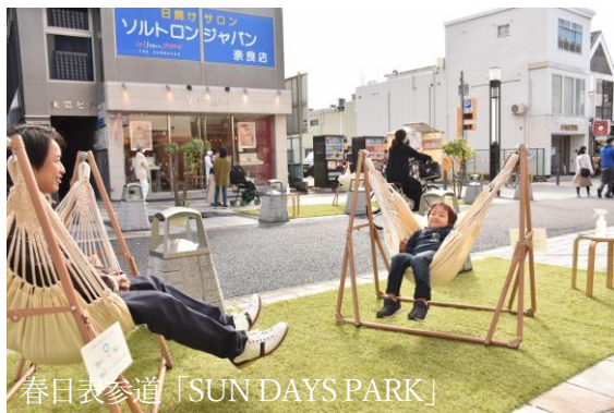
春日表参道「SUN DAYS PARK」