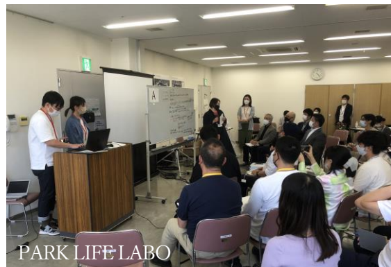
PARK LIFE LABO