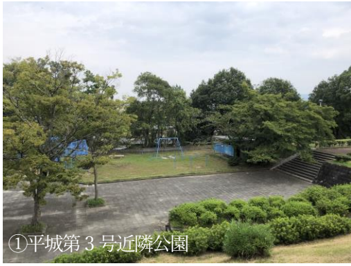
①平城第3号近隣公園