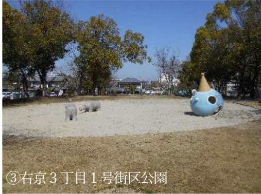
③右京3丁目1号街区公園