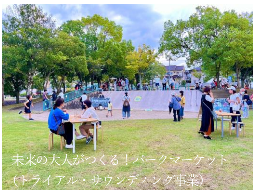
未来の大人がつくる！パークマーケット (トライアル・サウンディング事業)