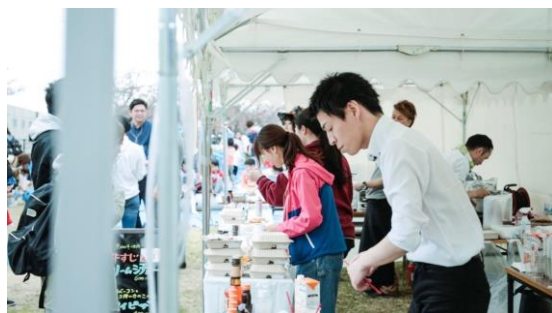
《マルシェイベント》