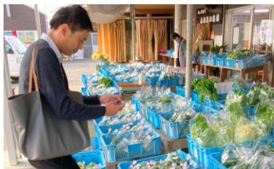
受注と特産品ピックアップ