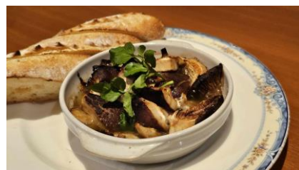
『菜宴』月ヶ瀬特産品を使った料理 「シイタケのアヒージョ」