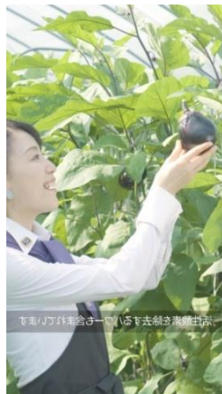
京都/ナブハ共会主催の「きょうと産物まつり」