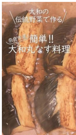
大和の伝統野菜で作る / 簡単!! 大和丸なす料理