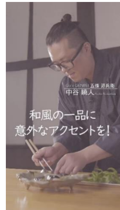
和風の一品に意外なアクセントを!