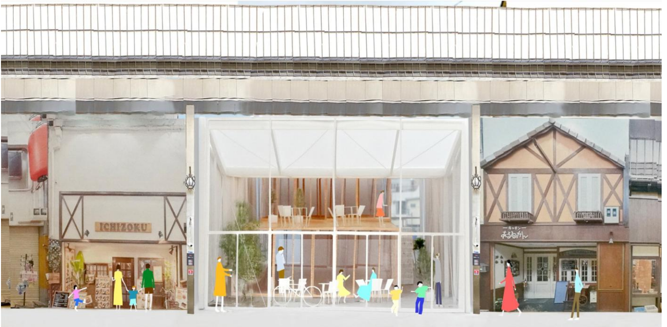
■ WaQWa の ハブ 構造

「夢 CUBE」で 60 人以上の卒業生を輩出してきた奈良・もちいどのセンター街が、次のステージへ踏み出す。新施設「もちいどの WaQWa」は、個店の集合体ではなく、起業者・地域・情報の 3 つのハブが連動する次世代の商店街モデルとなります。