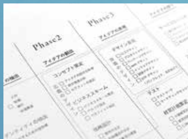
経営計画書、事業計画書(ビジョンシート)作成支援