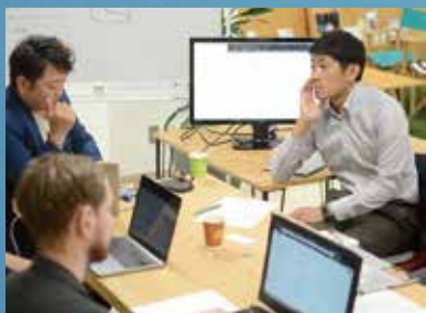
アイデンティティ型デザイン経営の伴走型支援によるコンサルティング