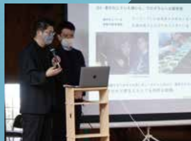
プログラムの最終成果発表会への参加 ※画像はイメージです