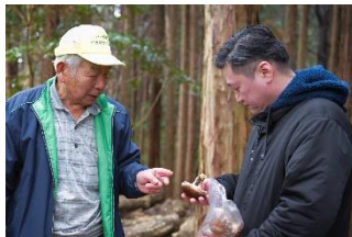
生産者と飲食店との交流