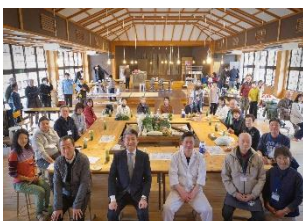
飲食店を交えた地域との交流会の実施

実証実験のパートナー飲食店において、月ヶ瀬の特産品を提供いただいたことで、特産品の持つ魅力の普及と向上に一定の効果がありました。令和6年2月4日(日)には、パートナー飲食店「四季の味 圓通」の店主と生産者の交流会も開かれ、市街地との関係人口創出に成果が出始めています。引き続き、月ヶ瀬地区に対する関係人口の創出も図ってまいります。