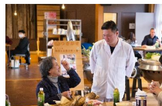
飲食店と月ヶ瀬住民との交流