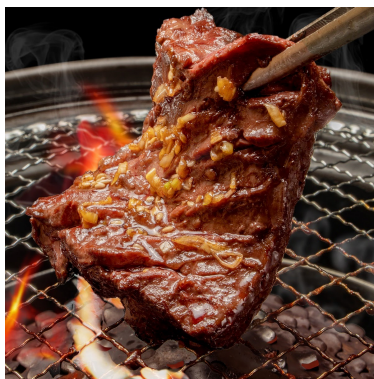
座布団ハラミ トリュフソース付き 1,089円 旨味がたっぷり詰まった肉厚ジューシーなハラミに食らいつけ！