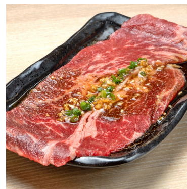
シン・ときわ亭コース 979円 皿からはみ出ると迫力の大判コース！キメ細かい肉質で旨味があふれます。