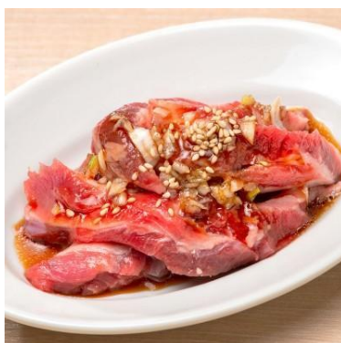
中落ちカルビ 759円 しっかりした肉感の旨味とジューシーな脂のバランスが◎