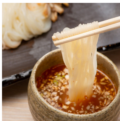
ときわ亭本家つけ冷麺 890円 メニューも充実。つるつとシコッとさっぱり冷麺。珍しいつけ麺タイプです。