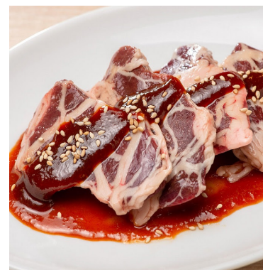
ときわ亭本家あみ巻きレバー 759円 牛脂の網で豚レバーを巻いた、リピーター続出の人気商品です。