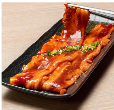
旨辛ヤンニョム牛カルビ 979円 「タレ界最強」×「焼肉界最強」夢のコラボ。ごはんが進みます！