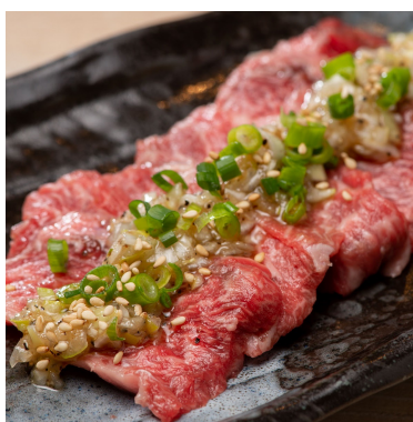
ときわ亭カルビ 869円 ブロック肉から部位ごとに解体し、1枚1枚丁寧に切りだしお店で仕込んでいます。新鮮で上質な国産牛カルビをリーズナブルにお楽しみいただけます。