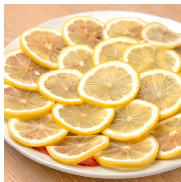
レモン牛たんカーベット 1,419円 薄切りの牛たんにスライスレモンを敷き詰め、お肉に香りを移すことで、牛たんの旨みと爽やかなレモンの風味が同時に楽しめます。