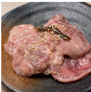
ときわ亭本家 昆布メ豚たん 638円 豚たんを昆布と酒粕で漬け込みました。レモンサワーと相性バッチリです。