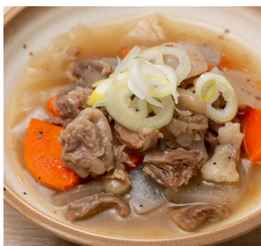
ときわ亭 自家製塩牛すじ煮込み 418円 牛すじや野菜の旨みを生かしたさっぱり塩味。毎日手間暇かけてコトコト煮込んでいます。