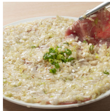
爆ねぎ豚たんカーベット 869円 まるまる1本以上の長ねぎをどどーんと豚たんに敷き詰めました！折れたたんで中面とねぎを蒸し焼きにしてどうぞ！