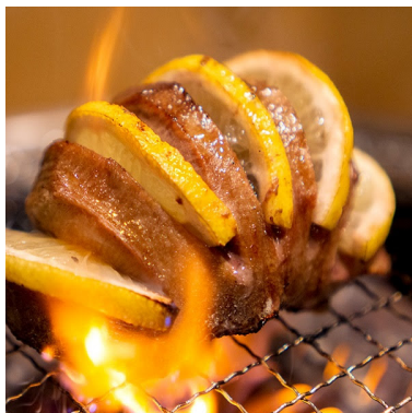
”肉塊”レモン牛たん 1,859円 牛タンの中でも特に柔らかいたん元の塊にレモンを挟んだ極上の一品。牛タン全体にレモンの風味が染み渡り、上質な脂がのったタンをさっぱり味わえます。

国産豚、小腸、大腸、ガツのミックスホルモンを秘伝の塩だれに漬けた「塩ホルモン」は、ほとんどのお客様がオーダーする、ときわ亭創業以来の人気メニューです。