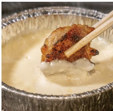
味噌とりちー 869円 ときわ亭猛者の多くがたどり着く、魅惑のスポットの筆頭。味噌とチーズ、2つの発酵食品のダブルアタックで旨味爆発！ 日本チーズ協会とのコラボメニューです。