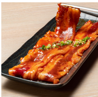
旨辛ヤンニヨム牛カルビ 979円 「タレ界最強」×「焼肉界最強」夢のコラボ。ごはんが進みます！