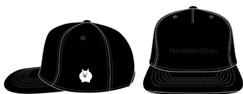
フロントバイザーキャップ