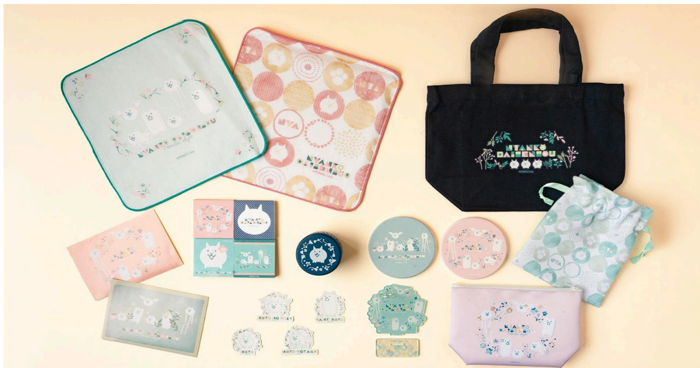
北欧風の「ノルディックスタイル」デザインのグッズ