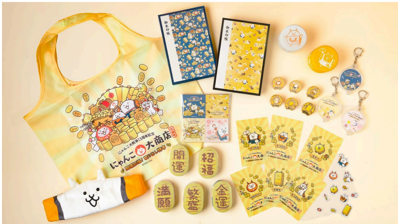
本催事のテーマである「開運招福」をモチーフにしたグッズ