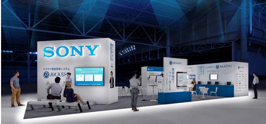
出展ブース:イメージ図