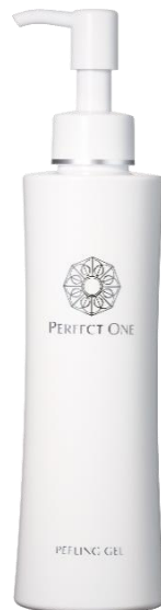
パーフェクトワン SP ピーリングジェル（200g/税込5,500円）

新日本製薬 株式会社（本社：福岡市、代表取締役社長：後藤孝洋）は、スキンケアブランド『パーフェクトワン』から、お風呂の熱と蒸気のを味方にしたスチームピーリング美容で、肌にやさしく角質・毛穴汚れを落としなめらか肌に導く「パーフェクトワン SP ピーリングジェル」を2021年5月15日（土）よりリニューアル新発売いたします。（期間限定※1）