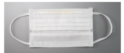
日中マスクをしたまま6時間過ごした後もファンデーションがほとんどついていません。

ゼリー状の美容成分「セラミドポリマー」配合のファンデーションが、シワに入り込み、肌にピタッと密着します。汗や皮脂に強い皮膜を形成し、肌表面をラッピングすることで、ハリと潤い、さらにメイクも長時間キープ。有効成分を肌に閉じ込め、メイク中のスキンケアを叶えます。