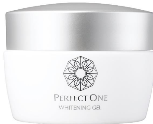
パーフェクトワン 薬用ホワイトニングジェル（75g／税込4,950円）

新日本製薬 株式会社（本社：福岡市、代表取締役社長：後藤孝洋）は、スキンケアブランド『パーフェクトワン』から、3つの有効成分 ※4 と浸透サポート成分 ※5 を配合した日本唯一 ※2 の美白 ※3 オールインワンジェル「パーフェクトワン 薬用ホワイトニングジェル」を2021年6月15日（火）より新発売いたします。