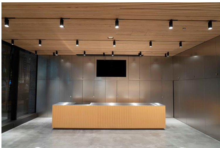
KRD Nihombashi Studio

2019年4月21日（日）開催【HP】 https://www.reage.jp/shokuyuu