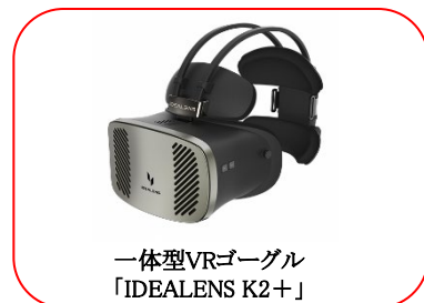
一体型VRゴーグル 「IDEALENS K2+」