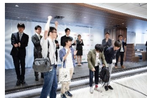
3位: 株式会社ハピネット

ポケモン企業対抗戦 公式サイト https://www.pokemon.co.jp/sp/fight_company/