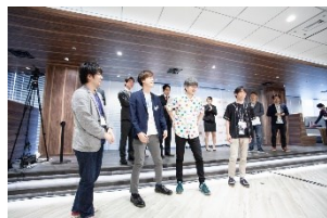
2位: 株式会社アニメイトカフェ