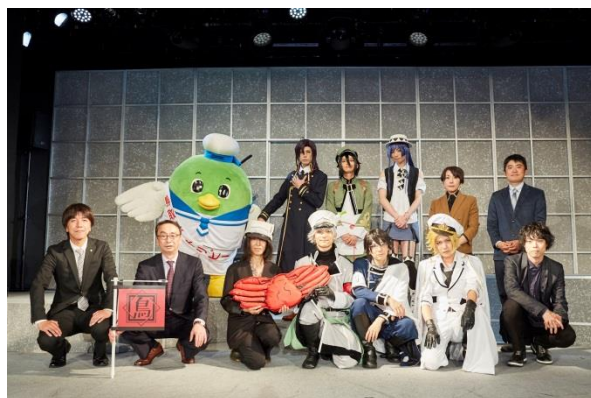
「しじゅステ」出演者・関係者による集合写真