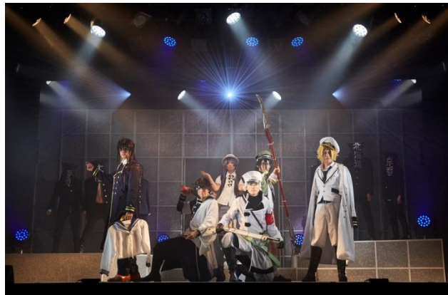
中国地方5県が集結!