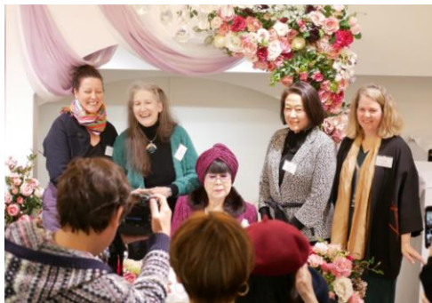
2019年12月13日の出版記念会見で、著者の方々と