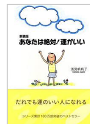
『あなたは絶対!運がいい』 (廣済堂出版:2007年)