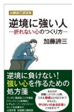
逆境に強い人 折れない心のつくり方 ほか多数