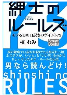
紳士のルールズ 持てる男の口説きのポイント73