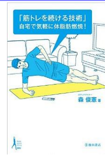
「筋トレを続ける技術」 自宅で気軽に脂肪燃焼!