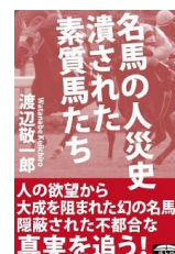
名馬の人災史 潰された素質馬たち