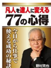
凡人を達人に変える 77の心得