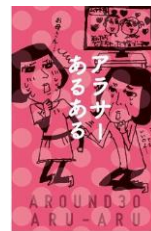
アラサーあるある